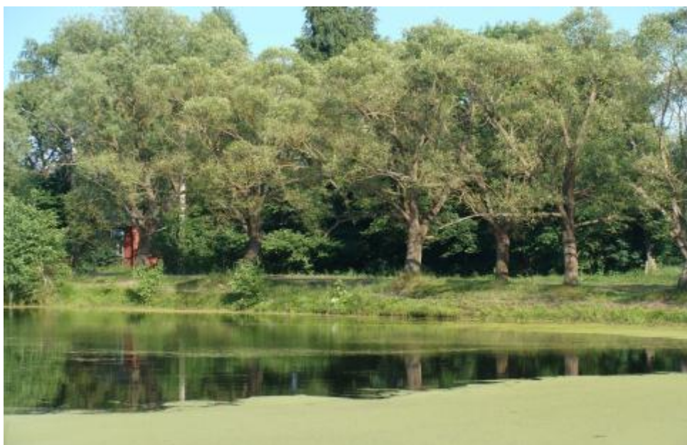
Объект № 4 - Ул. Озерная. Первое озеро

Речка Дерьба протекает через д. Шурубовка, с. Малые Щербиничи и впадает в реку Вагу.